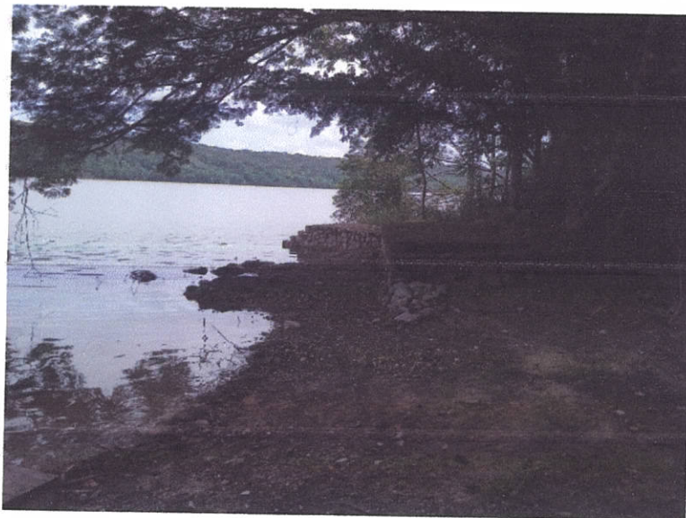
Fig.3: Muelle de Topoxte

Se trabaja una propuesta de rotulación interpretativa sobre los elementos naturales de Topoxte.