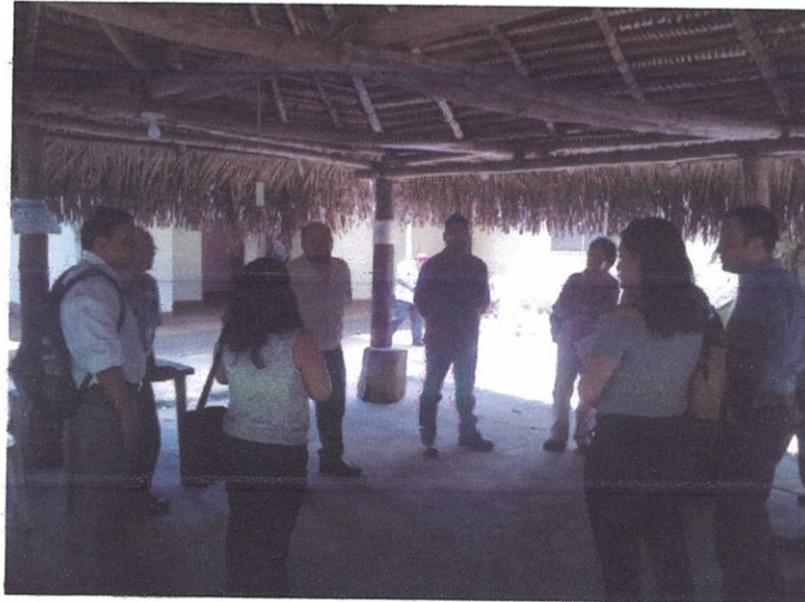
Fig.2: Visita a Takalik Abaj

Se realizó una visita al Parque Nacional Abaj Takalik con el fin de conocer la organización y acciones que permitieron la implementación de los requisitos para la la obtención del Sello Q.