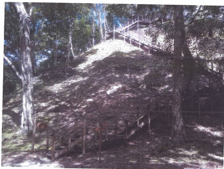
Fig.4: Infraestructura de uso público.

Previo a la salida vacacional de uno de los grupos de trabajo se observó el estado de la infraestructura con el fin de identificar fallas o daños que puedan poner en riesgo la integridad física de los visitantes.