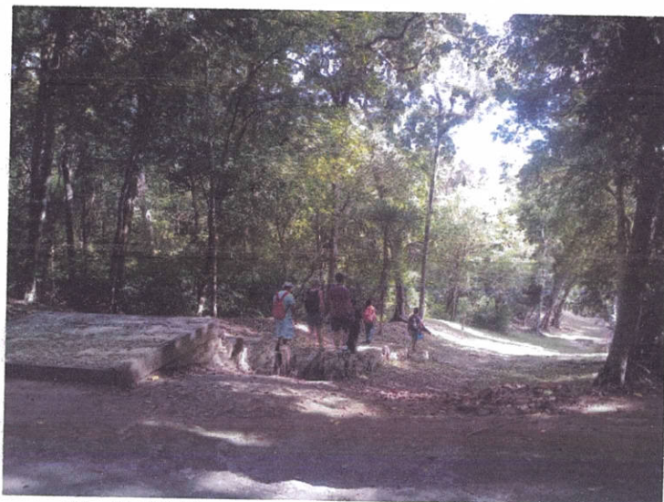
Fig.5: Visitantes en sitio arqueológico Yaxha

Con el fin de observar las actividades que se realizan en el área, el comportamiento de los visitantes y el trabajo del grupo de vigilancia.