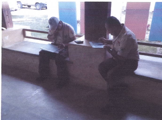
Fig.1: Control cruzado de boletos de ingreso.

Se lleva el registro de visitantes nacionales, extranjeros y exonerados. Con el coadministrador del área CONAP, se efectúa el control cruzado de ingreso de visitantes.